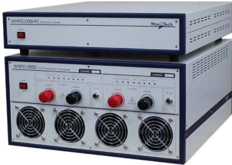
사진상의 WMPG1000HPC(8채널 제어기)는 별도