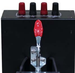
바나나 소켓 패널 및 클램프 레버