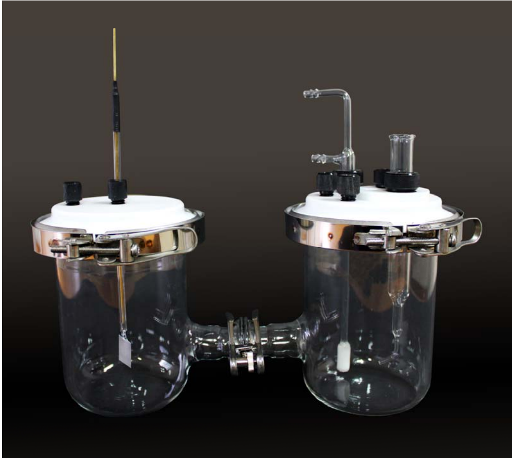
HCELL1带选购的铂片对电极

H型电解池组件包含两个玻璃电解池室，可以通过用户自备的一块薄膜或渗透膜互相连接起来。每个电解池室可以填充不同的溶液，用夹子将两个电解池室连接起来。每个电解池室的容积为1升。所有润湿部件均由耐化学腐蚀的材料(如Teflon、Pyrex和SUS 316)制成。