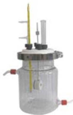
WCCK1(水浴夹套式电解池)