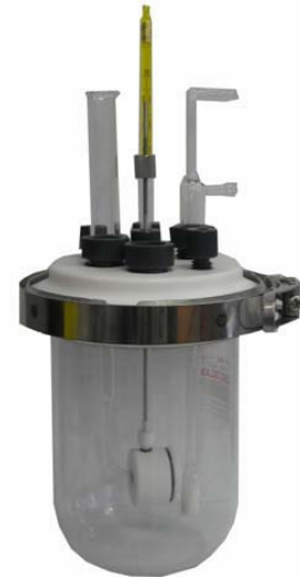
CCK1标准型带选配件FSH2 &温度计

CCK系列腐蚀电解池组件的核心是基于一个标准玻璃反应瓶，1升或100ml。所有润湿部件均由耐化学腐蚀的材料(如Teflon、Pyrex和SUS 316)制成。